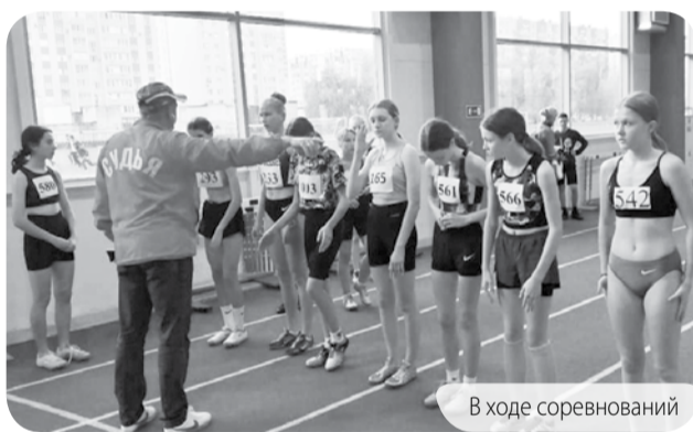
В ходе соревнований

В Ставрополе прошли Краевые соревнования по легкой атлетике, посвящённые Дню народного единства. МБУ «Спортшкола» ПМО представляли самые сильные легкоатлеты, наши звезды.