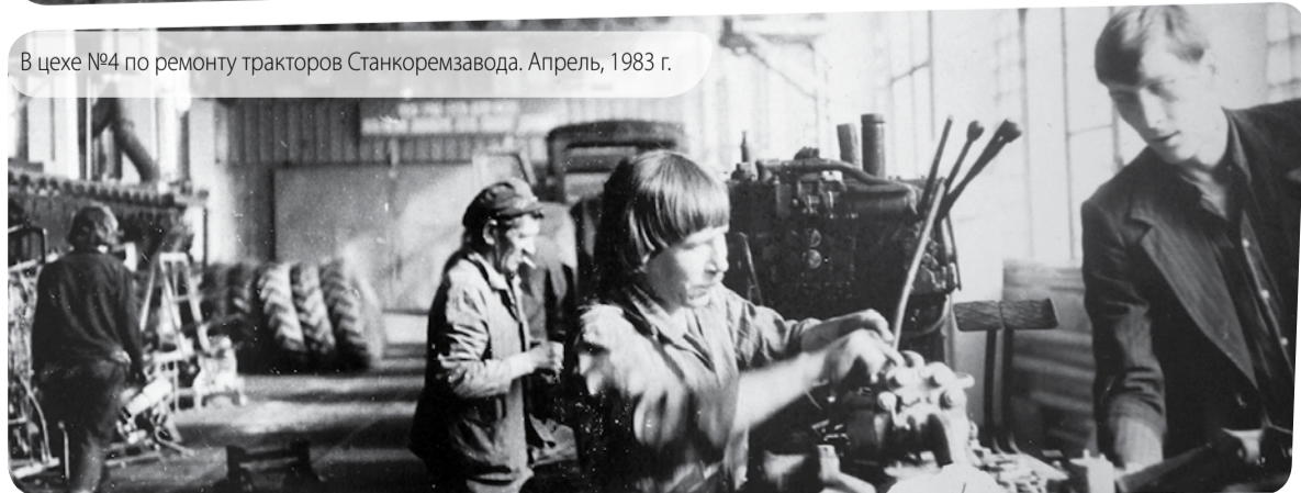
В цехе №4 по ремонту тракторов Станкореמצавода. Апрель, 1983 г.