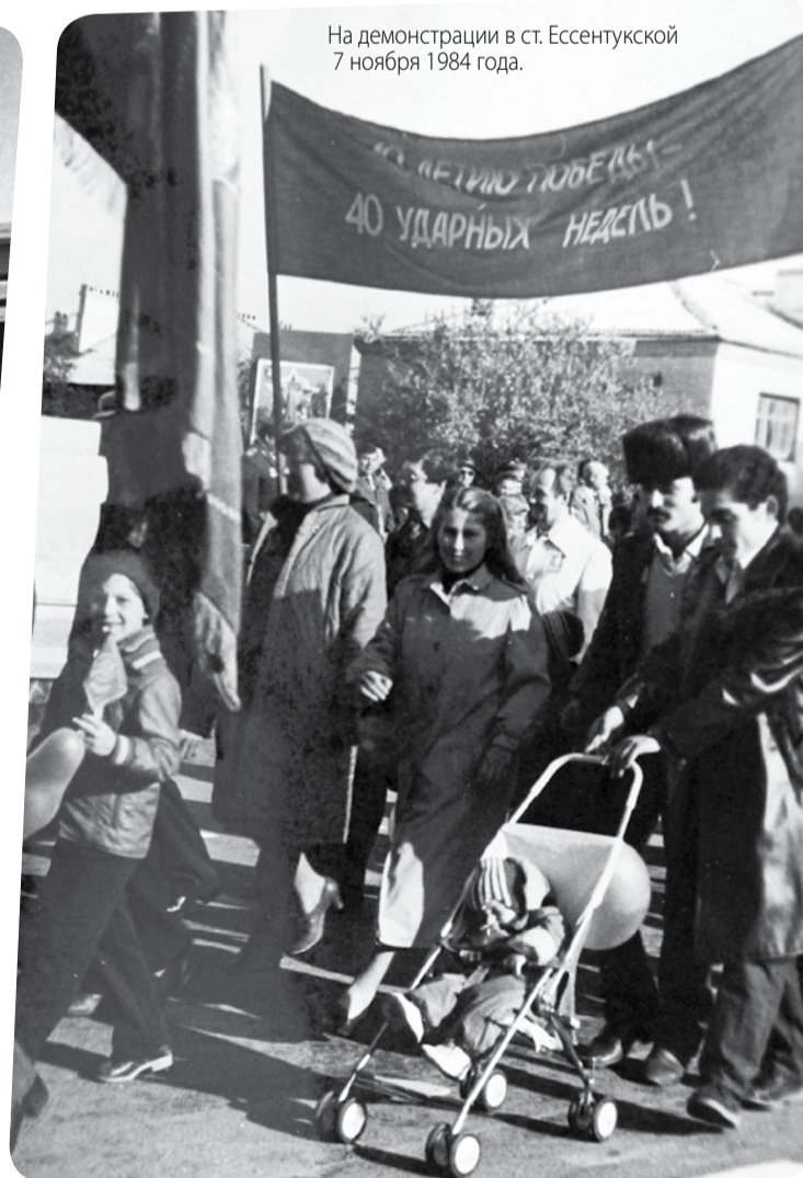
На демонстрации в ст. Эссентукской 7 ноября 1984 года.