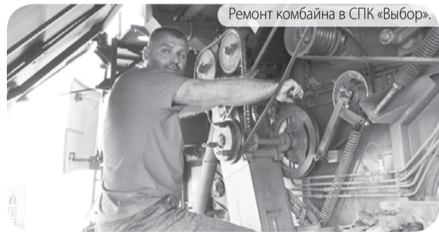
Ремонт комбайна в СПК «Выбор».

Так, на 15 ноября на склады ГСМ поступило 1630 т бензина и 6965 т дизельного топлива. В остатках соответственно 120 и 1155 т. Исправно 73% имеющихся в хозяйствах тракторов, в том числе две трети «Кировцев». Отремонтировано 30 тракторов, 59 находятся в мастерских. Также прошли плановые ремонтные работы 6 из 18 зерноуборочных и 3 из 6 кормоуборочных комбайнов. Исправны 175 из 205 плугов, 235 из 303 сеялок и 250 из 335 культиваторов. Ремонт техники и закупка ГСМ идут в соответствии с графиком.