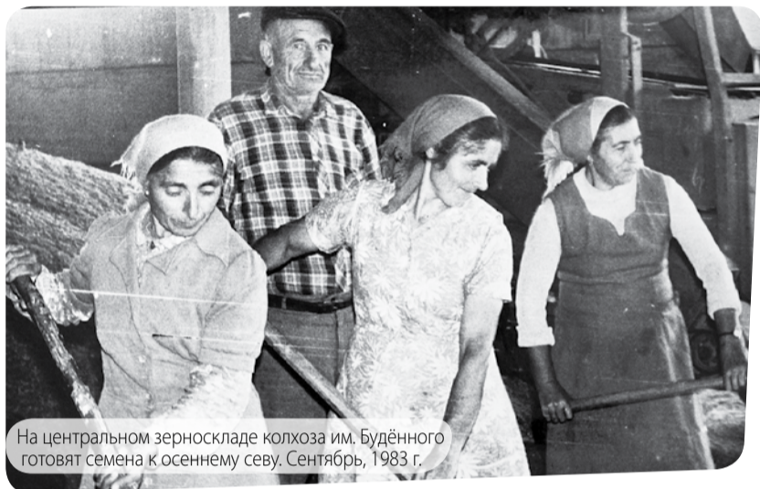
На центральном зерноскладе колхоза им. Будённого готовят семена к осеннему севу. Сентябрь, 1983 г.

Объективы В. Царева и В. Шевченко запечатлели моменты жизни Предгорного района и предгорненцев в начале 1980-х годов.