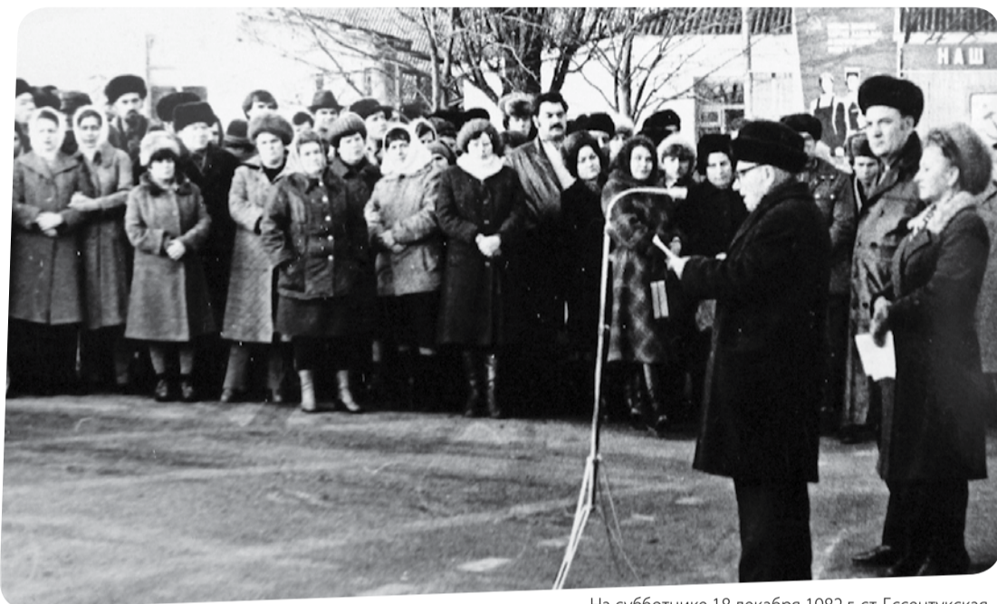
На субботнике 18 декабря 1982 г. ст. Эссентукская.