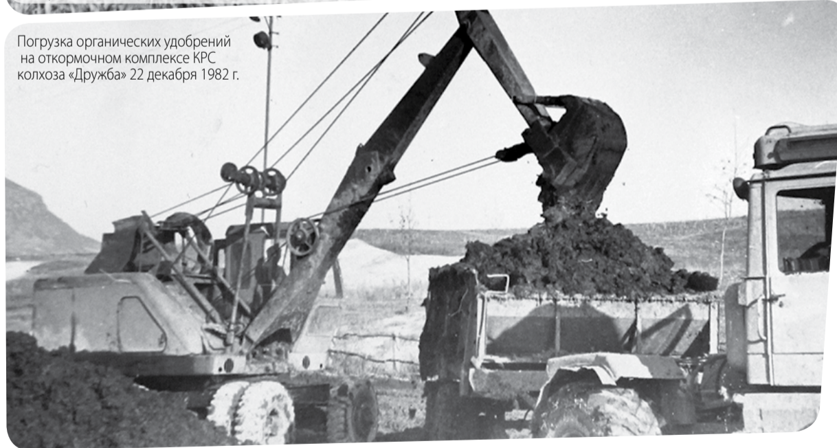
Погрузка органических удобрений на откормочном комплексе КРС колхоза «Дружба» 22 декабря 1982 г.