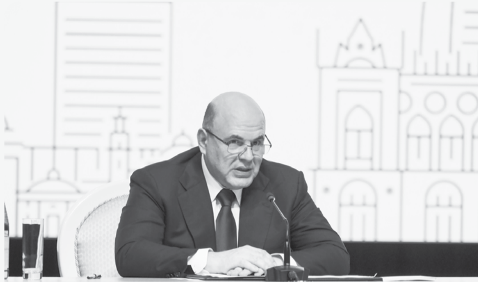
Михаил Мишустин отметил важность развития межрегионального сотрудничества для укрепления экономик России и Азербайджана в современных экономических условиях.

Ставропольская делегация приняла участие в XI Азербайджано-Российском межрегиональном форуме. На пленарном заседании присутствовали Председатель Правительства РФ Михаил Мишустин, премьер-министр Азербайджанской республики Али Асадов.